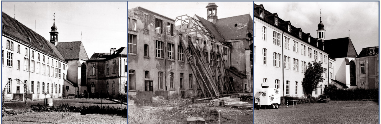
Rathaus, ehem. Berufsschule und Chor der Schlosskirche