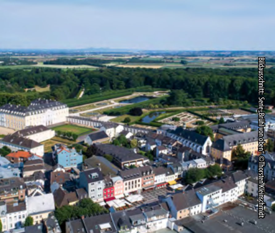
Bildausschnitt: Serie „Brühl von oben“

Nutzen Sie die Möglichkeit: Die „netten Toiletten“ finden Sie in den Betrieben mit dem „00-Gesicht“. Diese sind auch bei Veranstaltungen geöffnet. Die nette Toilette-App hilft Ihnen.